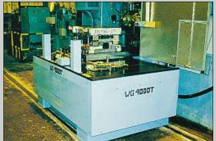
Rälsgående system för snabba byten Railbound system for quick changes Schienensystem für schnellen Wechsel