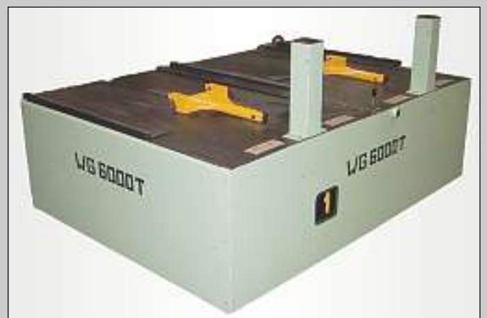
Knuff- och dragsystem med automatik Automatic push- and pull system Automatisches Schub- und Zugsystem