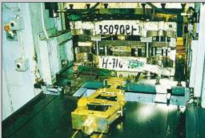
Överbrygning 0-1500 mm Extension 0-1500 mm Überbrückung 0-1500 mm