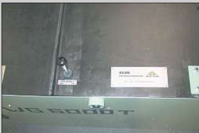
Snabb och säker positionering Quick and safe positioning Schnelle und sichere Positionierung