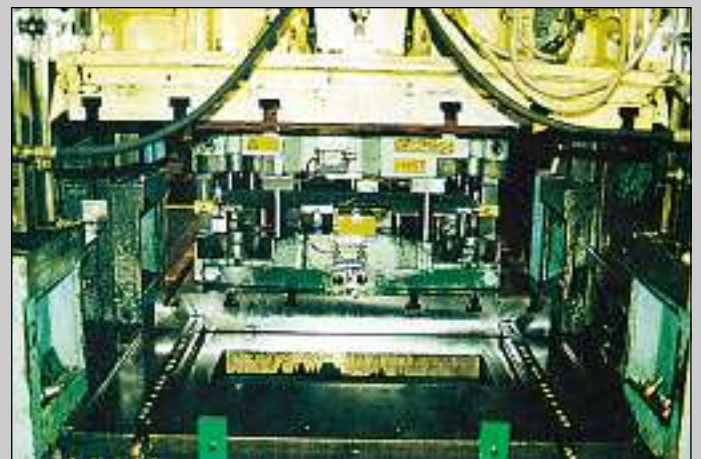
Verktygsbytestid inkl. fastspänning 3 min Die changing time incl. clamping 3 min Werkzeugwechselzeit mit Festspannung 3 min