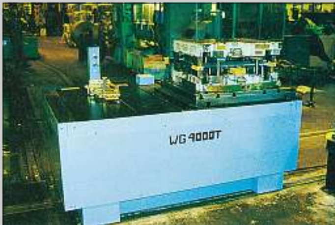
WG TANDEM för 2 verktyg WG TANDEM for 2 dies WG TANDEM für 2 Werkzeuge